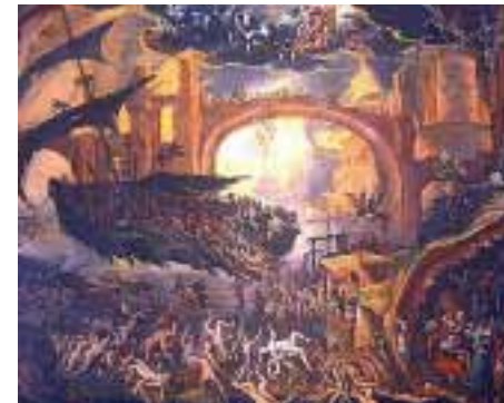
Die Mehrheit der Deutschen - ein Fall für die Hölle?

Wer als Katholik auch nur einen der nahezu 1000 kirchlichen Lehrsätze, Dogmen und Verdammungssprüche nicht glaubt oder nur daran zweifelt, für den heißt es: »...der sei ausgeschlossen«. Das ist die Übersetzung von »anathema sit«. Der Bann trennt den Betroffenen nicht nur von der Kirche, sondern auch von Gott, und führt zum Ausschluss vom Heil. Das heißt: Er landet in der ewigen Hölle. Und wenn die Kirche von »ewig« spricht, dann meint sie auch ewig: nie endende Höllen-