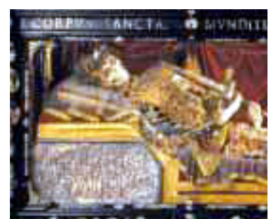
Heiligen- und Reliquienkult: Skelett in Münchner Peterskirche

475 - Zu verurteilen ist es deshalb, wenn Leute behaupten, man schulde den Reliquien der Heiligen keine Verehrung, keinen Ehrenerweis, oder es sei unnütz ... Sie hat die Kirche schon verurteilt und verurteilt sie jetzt aufs Neue.