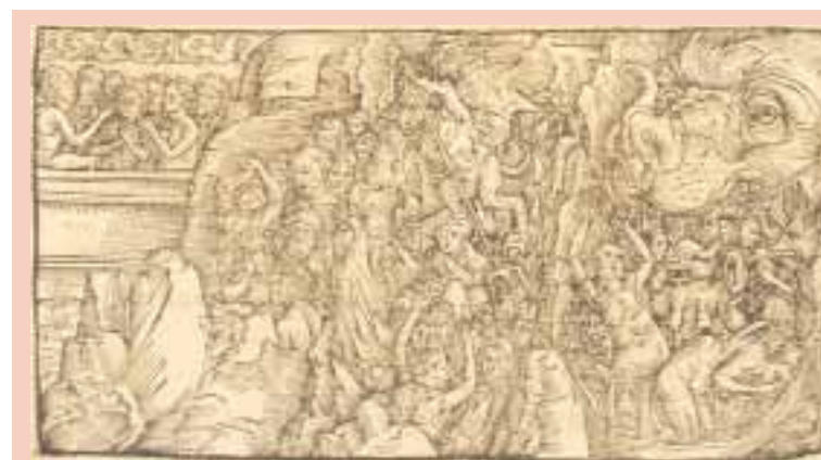
Titelbild des Koberger-Druckes aus dem Jahr 1500