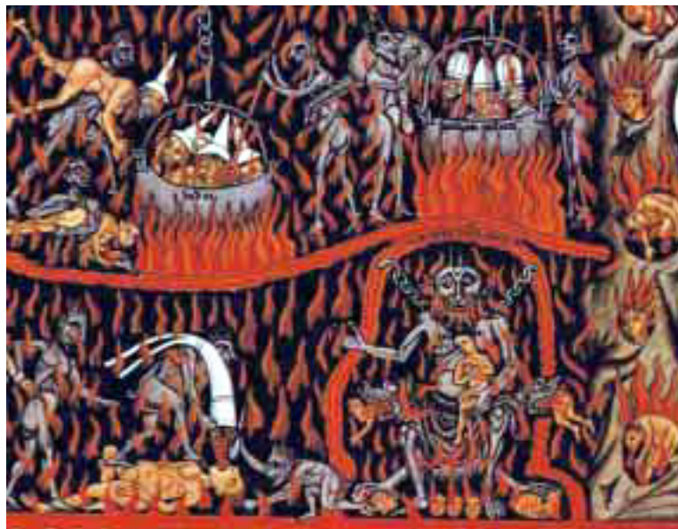
Darstellung der Hölle aus dem 12. Jahrhundert: Herrad von Landsberg, Hortus Deliciarum