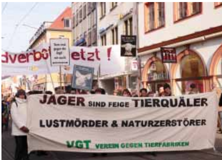
Falls es notwendig wird kommen die Tierschützer aus ganz Europa wieder - das nächste Mal aber mit noch mehr Freunden ...

Auch für das leibliche Wohl war bestens gesorgt: Am Imbiss-Stand wurden 1100 vegane Burger ausgegeben sowie vegane »Gulasch«suppe.