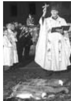
Tierfeindliche Kirche: Ein Priester segnet die Lust-Töter, ihre Waffen und die Opfer.

Über 1500 Jahre unterschieden Kirchenlehrer auf gleiche Weise zwischen Männern und Frauen: »Das Weib ist ein minderwertiges Wesen, das von Gott nicht nach seinem Ebenbilde geschaffen wurde. Es entspricht der natürlichen Ordnung, dass die Frauen den Männern dienen.« (Augustinus, 354-430, einer der bedeutendsten Kirchenlehrer) Papst Johannes Paul II.: »Eine Frau soll still zuhören und sich ganz unterordnen. Ich gestatte es keiner Frau zu lehren und sich über den Mann zu erheben. Zuerst wurde ja Adam erschaffen, und dann erst Eva.« Jahrhundertlang vertrat die Kirche auch den Irrglauben, dass Indianer und Neger minderwertige Wesen seien, weswegen man sie beruhigt versklaven und bedenkenlos töten könne. Heute braucht man das Märchen »Tiere haben keine Seele« als Rechtfertigung, um sie aufzuessen... - Anm. d. Red.