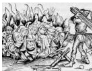
Bild: Verbrennung von Andersgläubigen, so genannten »Ketzer«. In der kirchlichen Inquisition zwischen dem 13. - 18. Jahrhundert wurden Millionen Menschen nach grausamen Folterungen umgebracht (manche Historiker sprechen bis zu 10 Millionen Menschen) - und auf einen verbrannten »Ketzer« kamen etwa 10 weitere, die gefoltert und zu langjährigen Kerkerstrafen verurteilt wurden...

nannten Hexenhammer verfassten zwei Dominikanermönche.